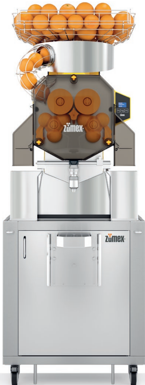
Speed Pro Self Service Podium