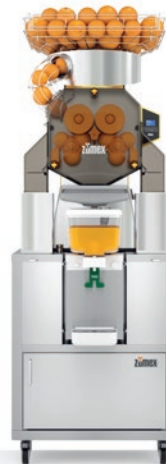
Speed Pro Cooler Podium