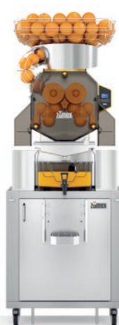
Speed Pro Tank Podium

Vielfältige Einsatzmöglichkeiten für den besten und am einfachsten erzeugten, am Point of Sale angebotenen Saft.